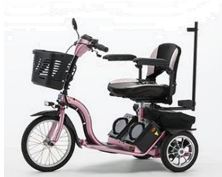
ハンドル型電動車いす