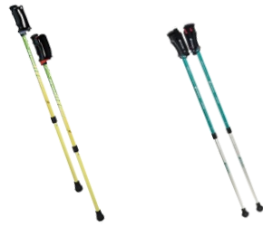
ノルディックウォーキングのポール