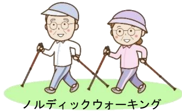
ノルディックウォーキング