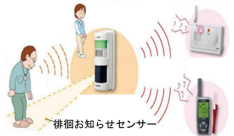
徘徊お知らせセンサー